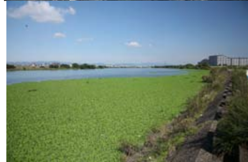
上：ボタンウキクサ。大きい株は30cmを超える。 下：繁茂するボタンウキクサ。芝生ではありません。 (撮影：志賀隆 2007年10月、大阪市旭区にて)