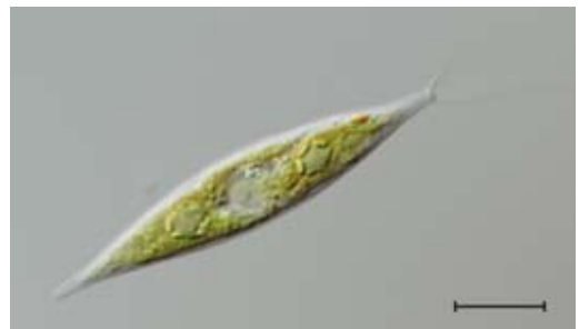
花田ヶ池産のカサキヤリミドリ。右上が前端(鞭毛が2本付いている)。スケールバーは10 μm。

何故このような細長い形が進化したのかは謎ですが、私は捕食者に対する適応ではないかと推測しています。同じ体積であれば細長い方が捕食者の口には入りにくいはずです。ヤリミドリの仲間「槍」の形で身を守っているのかもしれない。